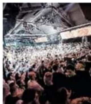
DIVERTIMENTO Giovani in una discoteca in una foto d'archivio