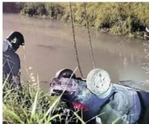
LA TRAGEDIA DI JESOLO L'auto sulla quale viaggiavano i quattro ventiduenni di Musile e San Donà