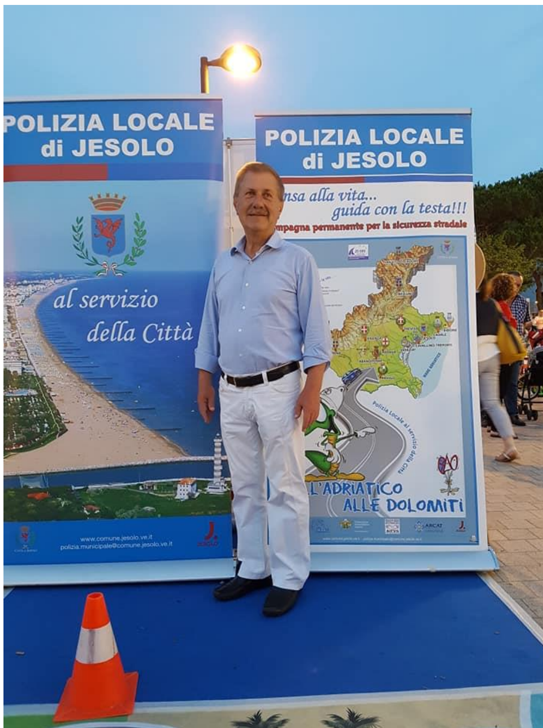
Il Sindaco di Jesolo Valerio ZOGGIA

Associazione maggiormente rappresentativa fondata il 17 marzo 1981 da Agenti, Sottufficiali, Ufficiali, Comandanti di Corpi e Servizi di Polizia Municipale e Locale Riconoscimento del Ministero LL.PP. - Decreto 10 dicembre 1993, n. 651 Riconoscimento Presidenza del Consiglio dei Ministri - Dipartimento della Funzione Pubblica - 2 marzo 2000